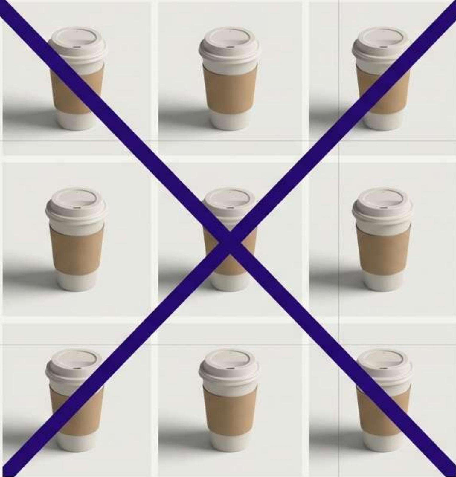
Fig. 1: Repetición de Mockups